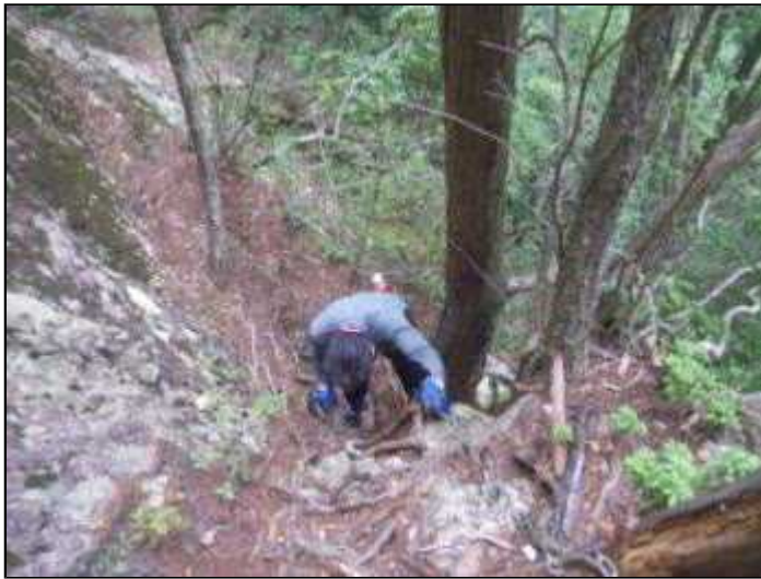
裏行場の垂直の下り(12:10)