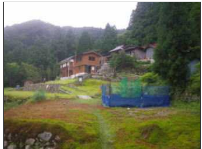
宿坊(13:25)、駐車場へ戻る(13:55)