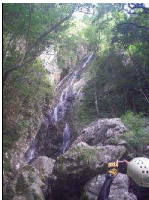
三重滝の一番下、左岸を高巻き(8:15)