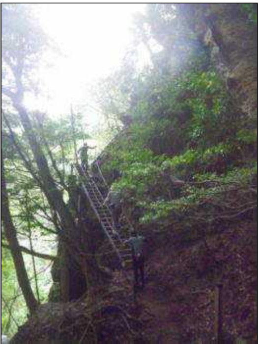
三重滝からの戻り(12:20)