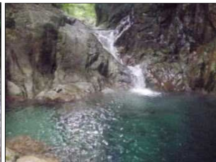
とにかく水が美しい(9:00)