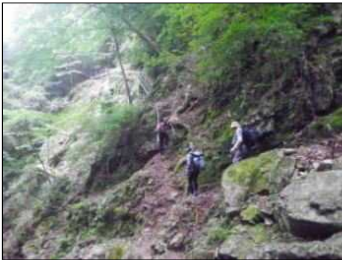
垢離取場(12:35)から宿坊へ(12:50)