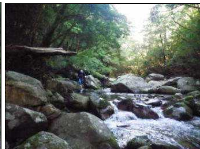
まずは黒谷を降りる(6:57)