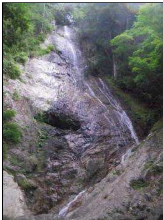
三重滝・下から2段目(11:30)