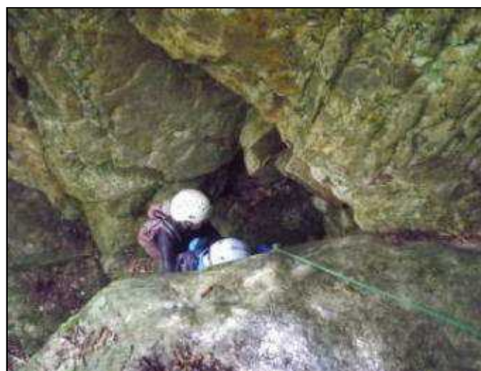
真上の写真と同じ岩を下りる(10:05)