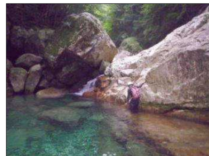
(9:30)この後二俣で引き返す(9:40)