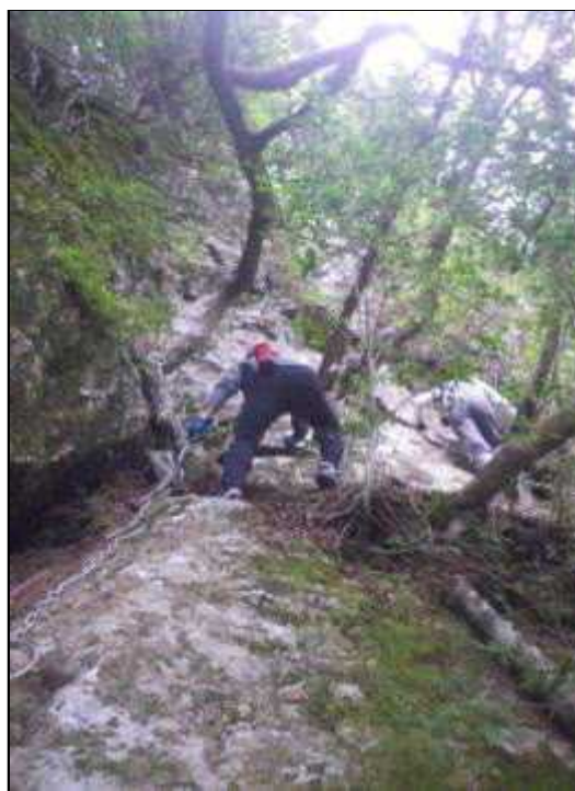
三重滝・下から3段目へ向かう裏行場(11:40)