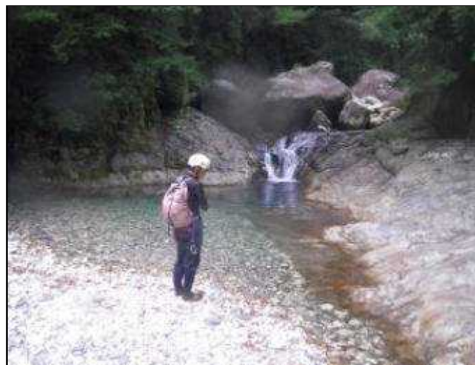
垢離取場(8:55)を行き過ぎる