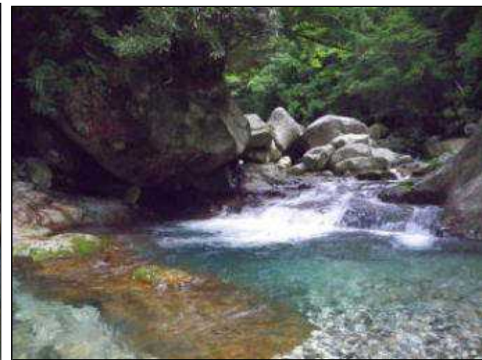
大岩の下をくぐる(7:20)