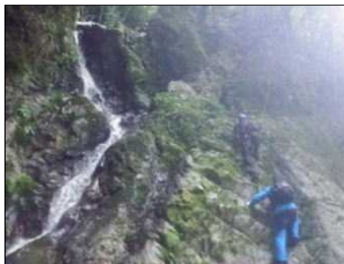
左岸高巻きの後、沢に復帰(8:20)