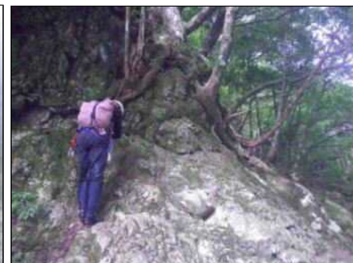
今度は右岸を小さく高巻き(8:25)