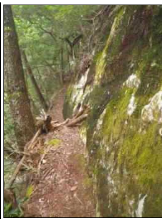
バンドの下は結構きれ落ちている(11:35)