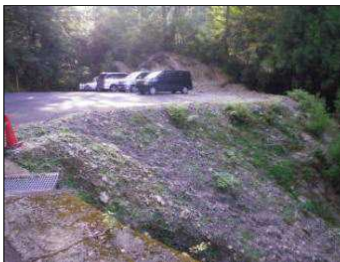
駐車場の手前から入渓(6:50)