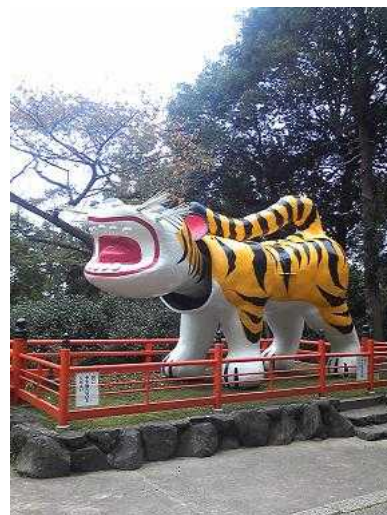
聖徳太子所縁のとら