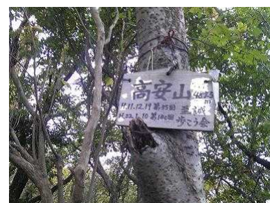
信貴山～高安山へ向かう