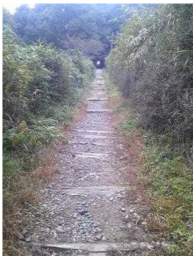
信貴山ケーブル跡地

スカイラインの完全開通は1960年、開通前の子供頃、ススキの生い茂る自然豊かなハイキング道を石切～生駒山～信貴山へと歩いた頃が懐かしく思い出される。