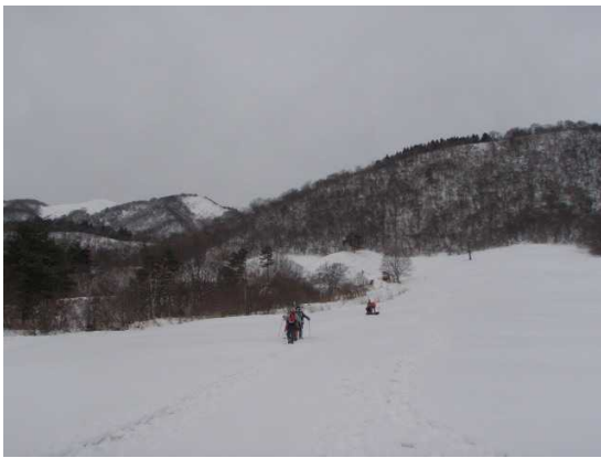
マキノスキー場 上部

大谷山からの下り初めは小さいピークをアップダウンしなければならず、スキーを付けたままではしんどかったが、下りとなるとやはりスキーは快適。樹間をぬって下まで滑り降りることができた。