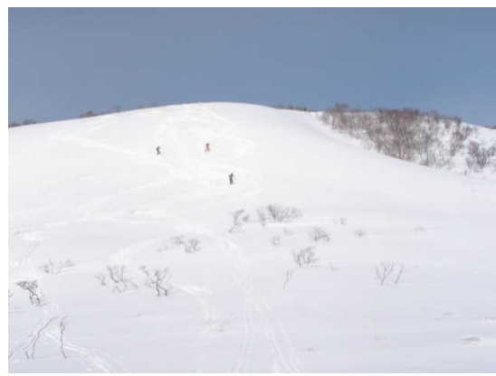
大谷山へ向かう斜面