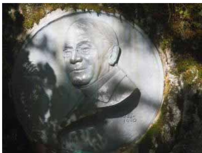
9:30、ウエストンレリーフ