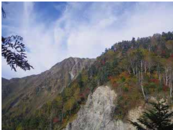
8:20、霞沢岳が見えて来た