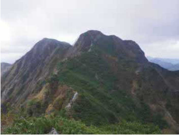
10:55、霞沢岳を振り返る