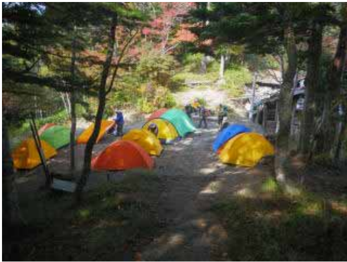
13:35、徳本峠のテント場