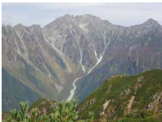
10:00、山頂より岳沢、穂高岳