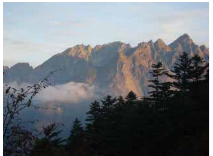
6:05、朝焼けの前穂高岳