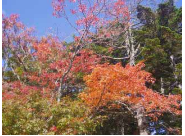
3:35、徳本峠小屋の紅葉