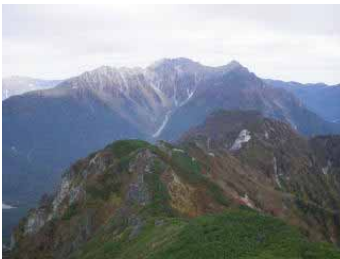
9:15、K1より六百山と穂高岳