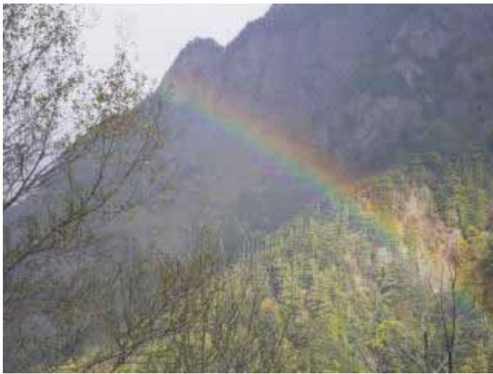
10/11、7:25、明神岳に虹がかかる

10/10は徳本峠小屋を6:30に出発。ほとんど休憩せず、10:00には霞沢岳山頂に着いた。山頂で20分ほど休憩したが、下りも休憩せず明神へは14:00に着いた。テント場や小屋で宿泊した人たちの半分ほどが霞沢岳に登り、残りの人は小屋近くの散策か島々あるいは上高地方面へ行ったようだ。我々は明神の山のひだやで宿泊。人工温泉に入り、ゆっくり明神の散策をした。