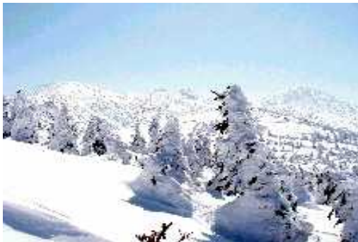
ロープウェイ付近より赤倉岳・井戸岳

滑り出しの急斜面ではあたり一面真っ白の中で突然足下の雪がなくなったかと思うほど切れ落ちたところがあり転倒したが、前嶽をトラバースしたあたりから晴れ間が見え出し、目標の建物も見渡せるようになった。しかも、それまであったトレースはすべて火箱沢林道に向かっているようで銅像ルートへ向かう竹竿の方にはまったくトレースがない。真っさらの雪面を自分たちだけのトレースを描くのはたいへん気持ちがいい。斜度も適当で木もまばら。どこでも好きなところを選んで滑ることが出来る。しばらく滑ったところ上の方から声が聞こえる。ガイドに連れられた連中が竹竿のコースをはずし、行き過ぎたところから大斜面を滑ってくるのだった。さすがにガイドはおいしいところを選んで滑らせるものだ。我々はそれを無視してどんどん先行する。