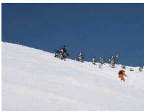
田茂范岳からの滑降

山頂の祠で小休止した後谷地温泉を目指す。前のパーティが少しためらっているのが見える。山頂からは下の方がまったく見えないが、なるほど少し滑ってみると500mほど木もなく急斜面が続いている。新雪だと一枚バーンの快適な斜面となるのだろうが、今日は少しクラストしており転倒するとかなり下まで止まりそうもない。妻は階段下降で慎重に下る。後で聞いたところ、このコースが八甲田の中で一番難しいルートらしいが納得できるところだ。斜度が緩くなってからは適度に樹氷も現れ楽しいスキーとなる。林の中に入ってしまうと20分ほどで谷地温泉だ。谷地温泉は酸ヶ湯温泉と同じ泉質のひなびた小さな温泉だ。ここからは青森駅と十和田湖を結ぶバスに乗って酸ヶ湯温泉に帰ることが出来た。