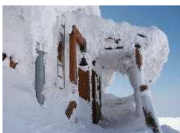
雪が少し解けてきた避難小屋

さて、もう一度ロープウェイに乗り今度は田茂范岳の山頂から大斜面を滑って宮様ルートと合流する。しばらく宮様ルートに沿って滑った後、井戸岳と大岳との鞍部にある避難小屋を目指してシール登行する。この避難小屋は我々が着いた当初完全に雪が凍りついていたのだが、最近の天気よさに雪も解けきれいな姿を見せている。小屋の中もすごく清潔で救助用のスノーボードも完備されていた。ここから大岳の中腹を巻いて小岳との鞍部まで滑り込む。トレースはいっぱい残っているが本当に人がいない。鞍部から小岳の登りは蔵王に似てきれいな形の樹氷を縫って行く。振り返ると大岳や井戸岳の勇姿がすばらしい。小岳山頂では近所に住むというおっさんが犬を散歩に連れて来ていた。小岳からは高田大岳の鞍部に向けてしばらく滑り、鞍部の手前で猿倉温泉への大斜面に行くことになる。目指すところさえ外さなければどこを滑ってもよい。このルートはめずらしくバス道ぎりぎりまで木がまばらで滑りやすいルートだった。スキーをはずして最後にストンと道路に滑り下りてフィナーレとなる。猿倉温泉へはバス道からまだ10分程歩くことになるので、今回はパスして酸ヶ湯温泉に戻った