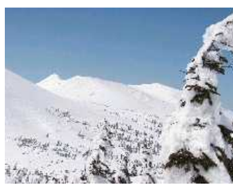
小岳より赤倉岳と井戸岳