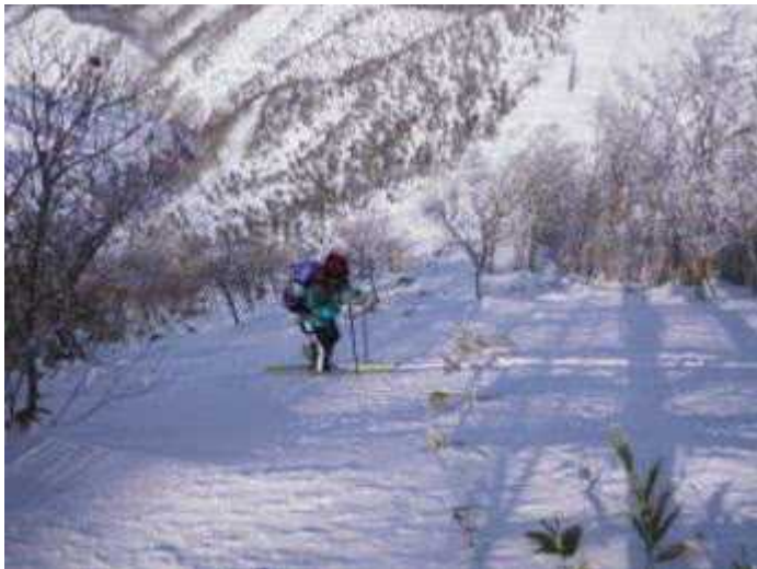
11:40、この後痩せ尾根に手間取る