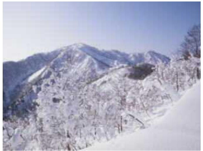
毘沙門岳の山頂が遠くに見える