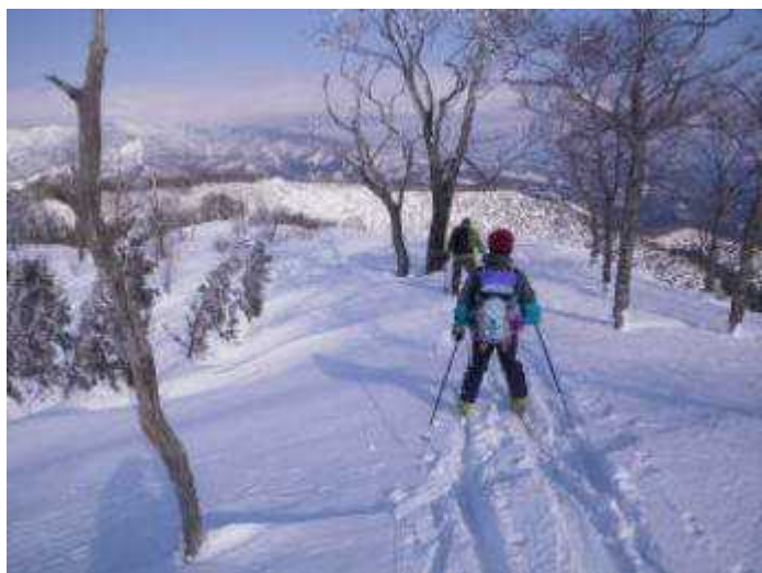
13:45、イトシロシャーロットへの分岐手前