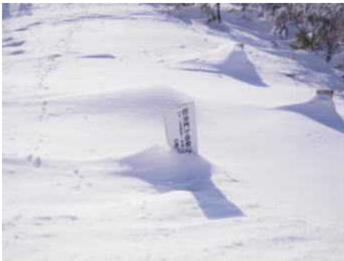
11:30、毘沙門岳手前の鞍部