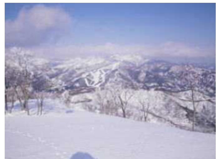
山頂からウイングヒルズ白鳥リゾート