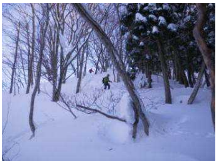
15:10、1000m付近で尾根を一つ間違う