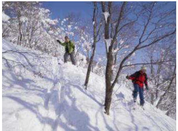
10:40、1201m ピークから下りに入る