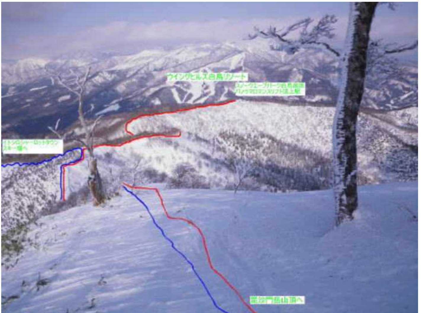
13:20、この後の痩せ尾根の右側は雪庇注意