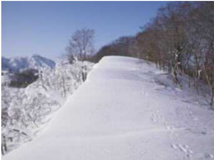
トレースはまったくなし