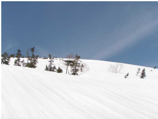
標高 2400m付近から頂上を見る