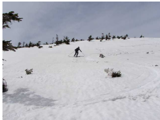
雪のコンディションは上々