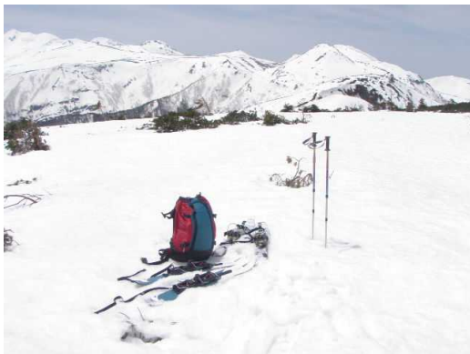
山頂から乗鞍岳の展望