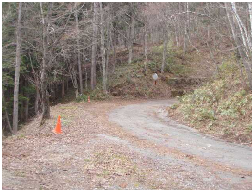
駐車地・登山道入口