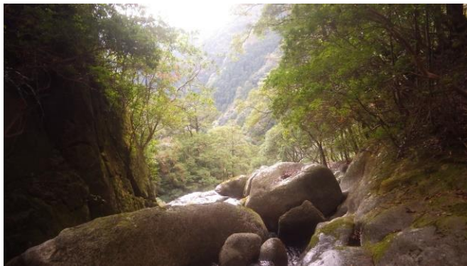
リッジを登り樺ノ戸滝の落口に降りる