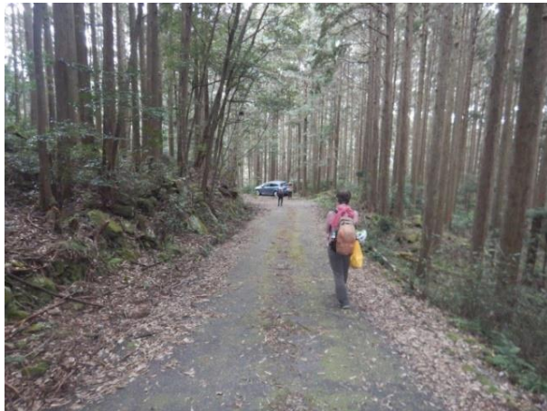
車のデポ地に到着。