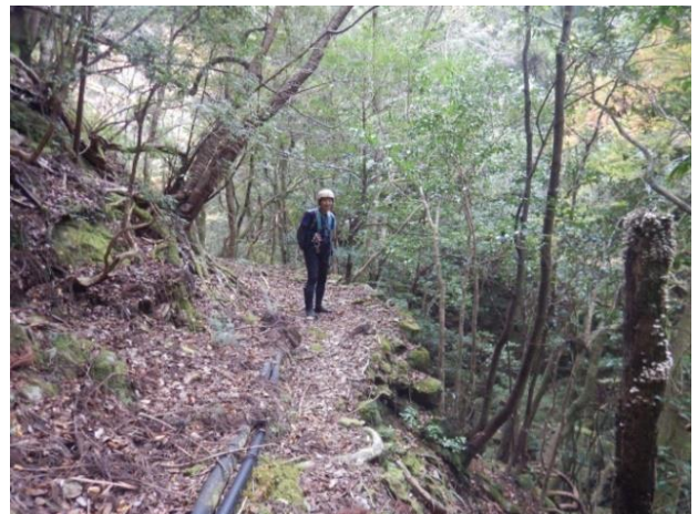
導水管が通っている杉道に出る