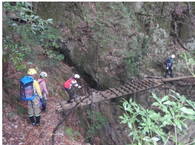
石垣が見えてくる先で遡行を終了した。