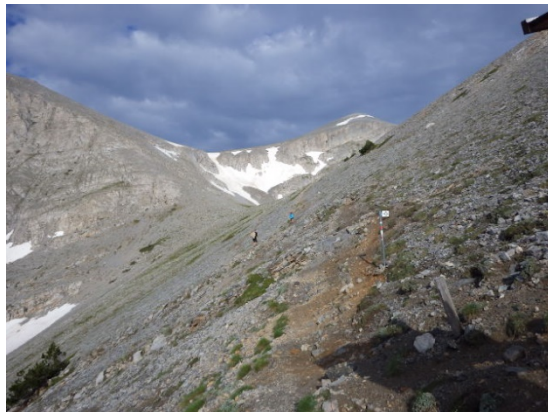
スコーリオが見えてきました