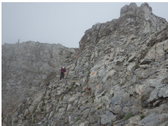
ミディカスへは岩場が続きます