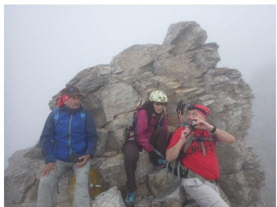
写真は出会ったロシア人？