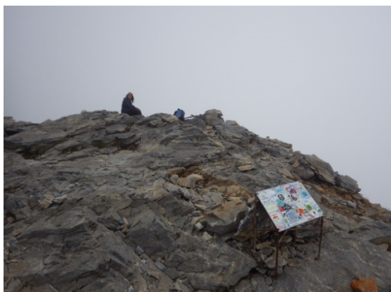
天気が怪しくなってきた