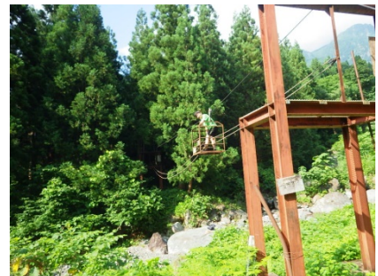
登山口からすぐのところにある野猿