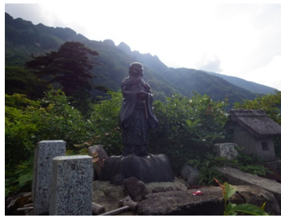
屏風道七合目（ノゾキの松）